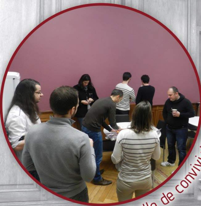
Salle de convivialité