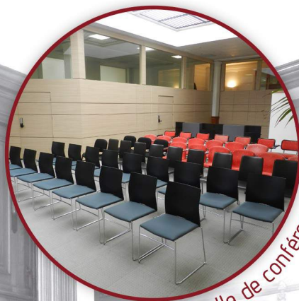
Salle de conférence