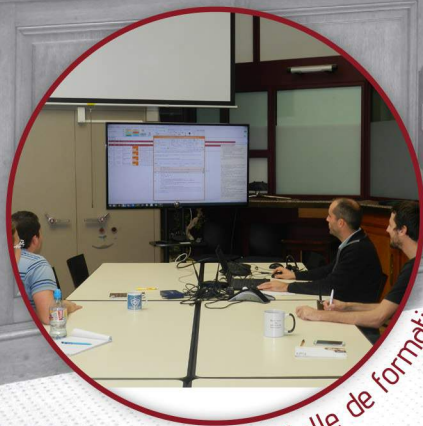
Salle de formation